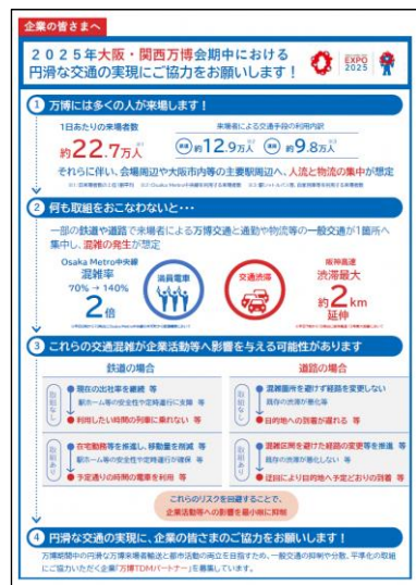
万博TDMパートナー登録企業募集のチラシ